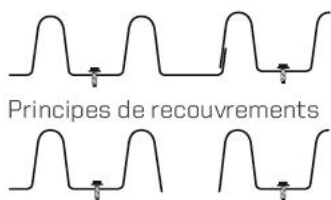
Principes de recouvrements